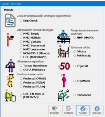
Figura 1: Acceso al módulo Posturas [REBA]

Esto da paso a la ventana principal del módulo (Figura 2) que contiene lo siguiente: