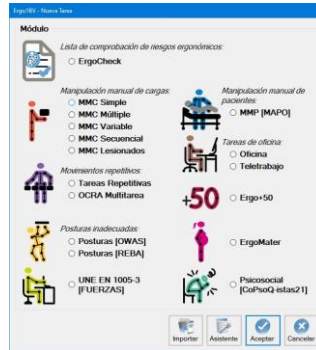
Figura 1. Acceso al módulo MMC Lesionados

Esto da paso a la ventana principal de este módulo (Figura 2), donde se observan tanto los datos de entrada como los resultados calculados por la aplicación.